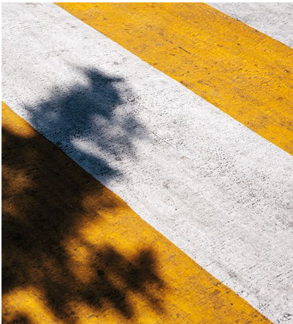
درباره رنگ پنتون سال 2021

پنتون سالانه رنگ سال خود را به دنبال تجزیه و تحلیل گسترده ای از تأثیرات رنگ از سراسر جهان تعیین می کند که از روند هنر و مد تا شرایط اقتصادی-اجتماعی متفاوت است. برای سال ۲۰۲۱ ، دو سایه خیره کننده را انتخاب کرد که با هم ترکیب می شوند و احساس قدرت و امید را منتقل می کنند و برای آینده حس مثبت ایجاد می کنند. این یک موضوع عالی برای الهام بخشیدن به ما برای رفتن به یک سال جدید است